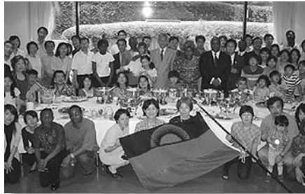
▲参加者全員で記念撮影

参加者は、遠くは新潟県から来た人など総勢約 70 名となり、当会創立 20 周年記念にふさわしい「シマを食べる会」となった。