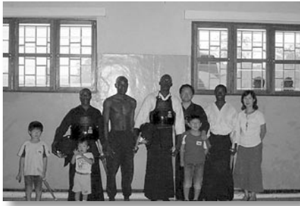
▲剣道協会メンバーと家族で

当日は折しも雨季特有の大雨、10人くらい来ているはずの部員は4名でした。雨が降るとスケジュールが狂うマラウイならではのということでした。最初でしたので、まずは全部の稽古に参加しようと思い、体操・素振り・基本打ち・試合稽古と順番にこなしたのですが、彼らの印象は当初思っていたのとは全然違いました。まず、非常に礼儀正しいということ。日本の学校で教えている剣道は試合が多く、勝つことに集中するあまり、普段の態度に問題があることもあるのですが、彼らはそうではなく、「礼に始まり礼に終わる」という正し