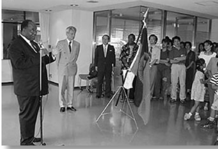
▲シマを食べる会で挨拶する Chikago 大使 (左)

谷恭二氏より、マラウイ在任中に亡くなった 12 名の隊員の名前が読み上げられ、全員で 1 分間の黙祷を行った。