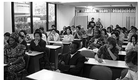
▲国情セミナーを熱心に聴く参加者

午後 3 時からは、玄関前の物故隊員慰霊 碑前に集まり、Chikago 大使と数原会長が 献花した後、元 JOCV マラウイ調整員の水