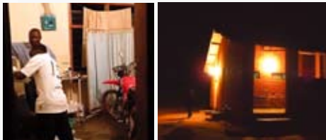
▲写真⑤夜間医療行為の様子 ▲写真⑥夜間照明により明るい環境