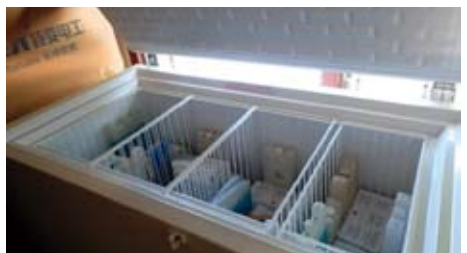
▲写真③ 新設された電気冷蔵庫