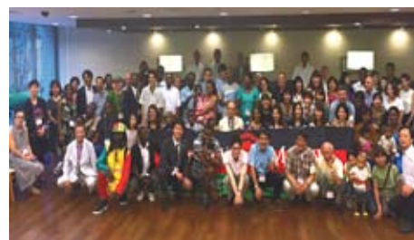
▲シマを食べる会お開き後、全員で

今年の参加者は、大使・大使館職員・家族：在日マラウイ人、OB/OG 80 名程度。熱気に包まれた会場でシマを食しながら独立 52 周年を祝い、懇親を深めた。