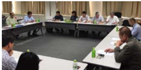
▲通常総会での一コマ

一方、7 月 16 日 (土) 13:00 からは同じく JICA 地球ひろばセミナールームにて理事会が開かれ、今年度第 1 四半期の活動報告が行われた。