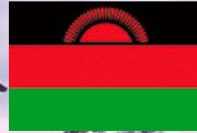
マラウイ共和国 国旗

日本とマラウイ両国間の理解を深め、文化、スポーツ、経済、科学技術等の協力を通じ、相互の繁栄に寄与することを目的とする任意団体です。趣旨をご理解の上、広く各位の入会を希望します。会員数：196 人 (5 月現在)