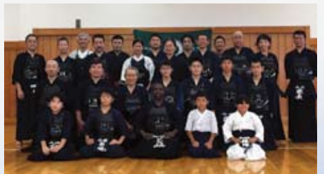
▲町田市山崎剣友会/緑ヶ丘剣道クラブの皆様と

その後、財務省剣道部での稽古会、東京都町田市の剣友会での稽古会、そして、愛知県のトヨタ自動車剣道部での稽古会と、帰国までに三つの稽古会に精力的に参加しました。