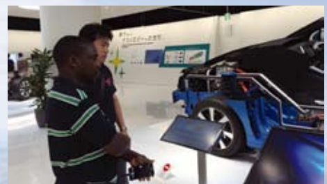
▲愛知県トヨタ自動車会館にて

観光としては東京スカイツリー、浅草寺、トヨタ自動車会館&工場見学、名古屋城などをとても限られた時間の中で楽しみ、8月2日、日本での全日程を終了し、帰国の途に就きましたことを報告させていただきます。