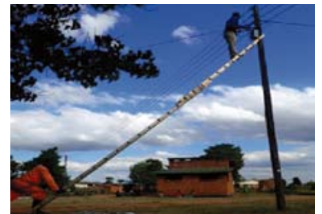
▲写真① ESCOM 作業風景 1