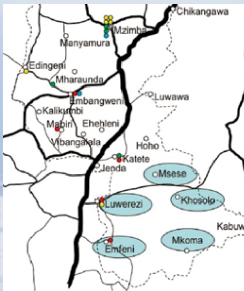
図① Luwerezi H/C クラスター地図