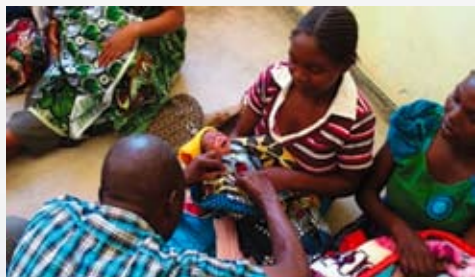
▲写真④予防接種の再開

マラウイ剣道協会の Facebook をインターネット上でチェックして下さいの皆様におかれまし