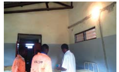
▲写真② ESCOM 作業風景 2