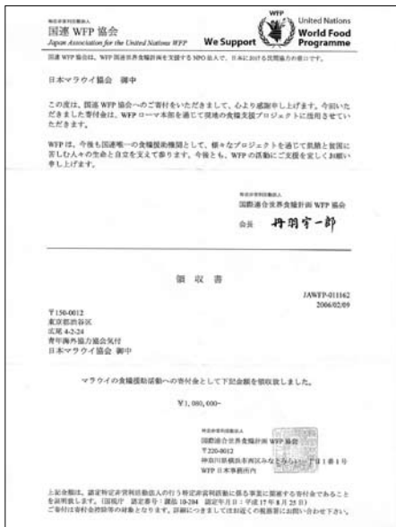
▲国連 WFP 協会からの感謝状と領収書

皆様のご厚意にお礼申し上げるとともに、すべてのマラウイ人が困難を乗り越えて笑顔を取り戻すことを願っています。ありがとうございます。ありがとうございました。