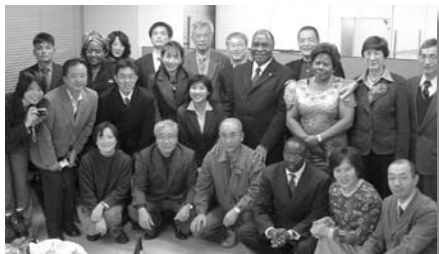
▲チカゴ前大使夫妻と参加者

これらのことを新大使に伝えたい。ただし、日本からどれだけのことを学ぶことができるかは自分たちにかかっている。私は現大統領に日本訪問を要請している。