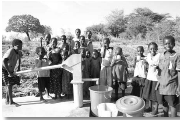
▲完成した手押し型ポンプで タンクやバケツに水を汲む子供たち

これらは、プロジェクト終了後、配属先である保健衛生部門や、地域住民、PTA を巻きこみ、足運び、経過を見ていきたいと考える。