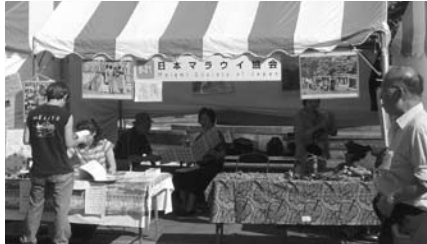
▲グローバルフェスタ 2005 出展の様子

当日は割り当てられたテントに、マラウイ国内の写真パネルや、当会や当会の活動を紹介するパネルを展示しました。また、当協会編集の国情紹介誌「マラウイ The Warm Heart of Africa 第2版」や旅行ガイドブック「暖かきアフリカの心 - 湖とサバンナの大地へ」、「チェウ語辞典改訂版」をはじめ、JOCV マラウイ派遣 OB/OG が持ち帰った民芸品などの販売を行い、来場の方々へマラウイの紹介案内に努めました。