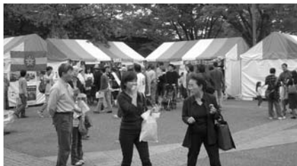
▲JICA ボランティアフェスタ会場内の様子

当会テントには、マラウイ協力隊派遣初期から最近帰国した方まで多くの隊員 OB/OG が訪れました。また、派遣前でこれから訓練所へ入る方が、テント内での作業を手伝ってくれ、世代を越えた交流が広がり、40周年記念にふさわしいイベントになりました。