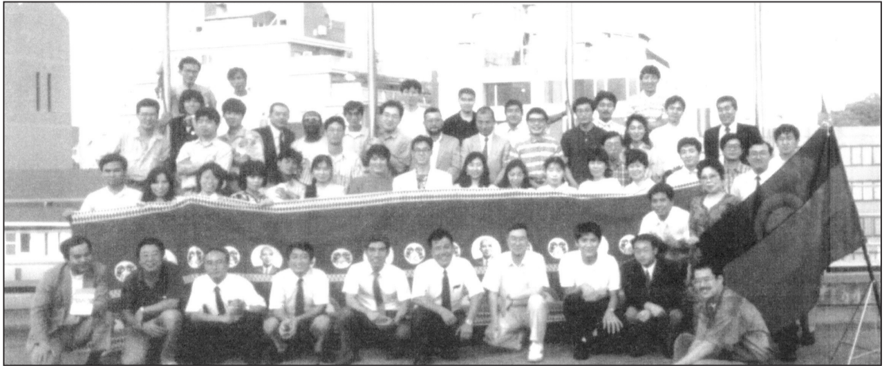
参加者全員とマラウイ国旗、バンダ大統領のプリントされたチテンジで記念撮影 1991年7月6日 マラウイ独立27周年記念日 ~協力隊事務局屋上にて~

最後に屋上に全員集合して記念撮影を行い、来年の再会を約し、盛会のういに散会した。